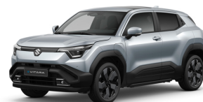
Splendid Silver Pearl Metallic

NB. Visi paveikslėliai yra informacinio pobūdžio. Stogo, šoninių veidrodėlių, stogo skersinių, ratų skydėlių, galinių langų ir pan. spalva priklauso nuo pasirinkto komplektacijos varianto.