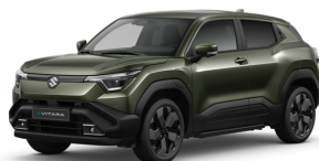
Land Breeze Green Pearl Metallic