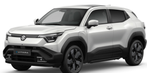
Arctic White Pearl