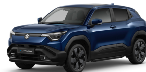
Celestial Blue Pearl Metallic