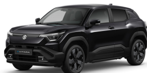
Bluish Black Pearl