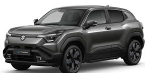
Grandeur Grey Pearl Metallic